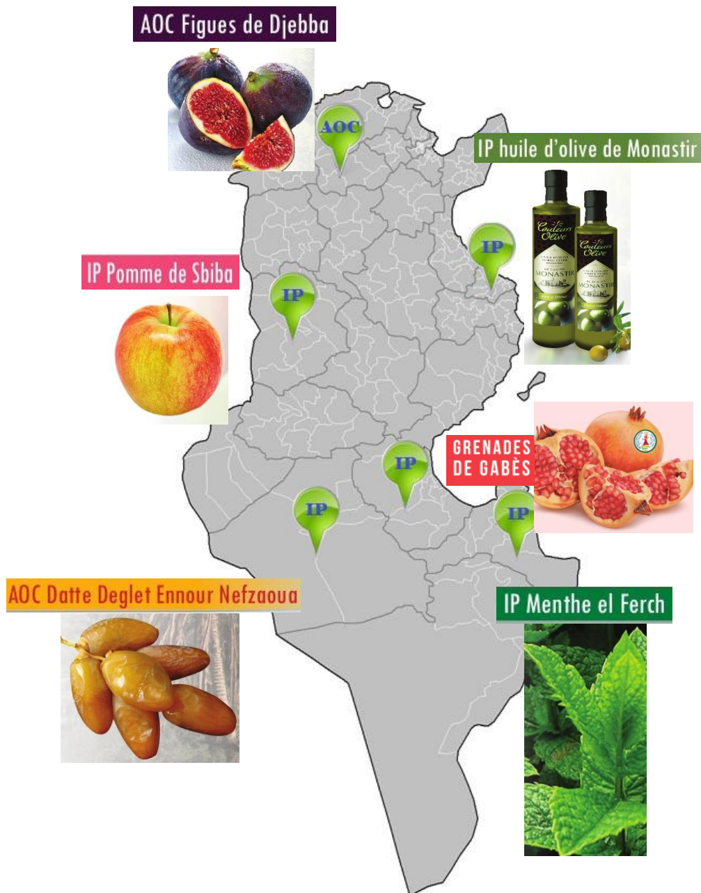
Figure 4. Carte AOC/IP de la Tunisie (MARHP, 2024)