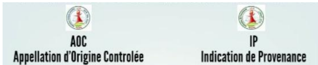
Figure 2. Les signes de qualité en Tunisie.